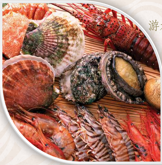
游水龍蝦、皇帝蟹及蟹 海鮮活造り